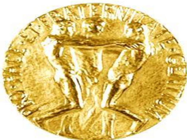
Sülh üzrə Nobel medalı