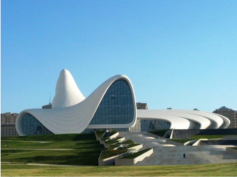
Bakı Heydər Əliyev Mərkəzi