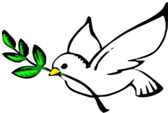
Birinci Ümumdünya Konqresinin simvolu- “Sülh göyərçini”