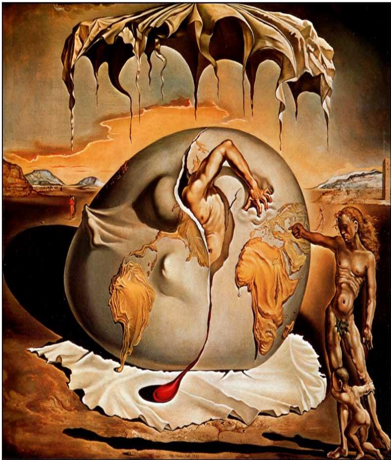
Salvador Dal  – “Geopolitik uşaq yeni insanın doęulmasına baxır”

masını uşağa göst r r v  bu zaman barmağını qlobusda d z Bakı şəh rinin  z rin  qoyur.