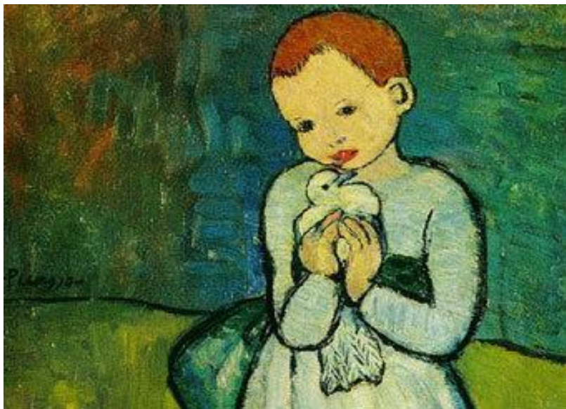
Pablo Pikasso – “Göyərçin və uşaq”